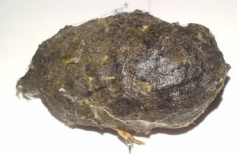
*pelote de réjection

On trouve la chouette effraie partout dans le monde. Elle vit dans les granges, les greniers, les vieilles bâtisses et les troncs d'arbres.