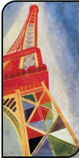
Huile sur toile, 1926 (1,69 m x 0,85 m)