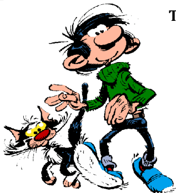
Gaston Lagaffe, par A.Franquin en 1957