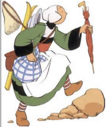
Bécassine, par J.P.Pinchon en 1905