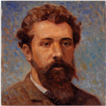
Portrait de Georges Seurat