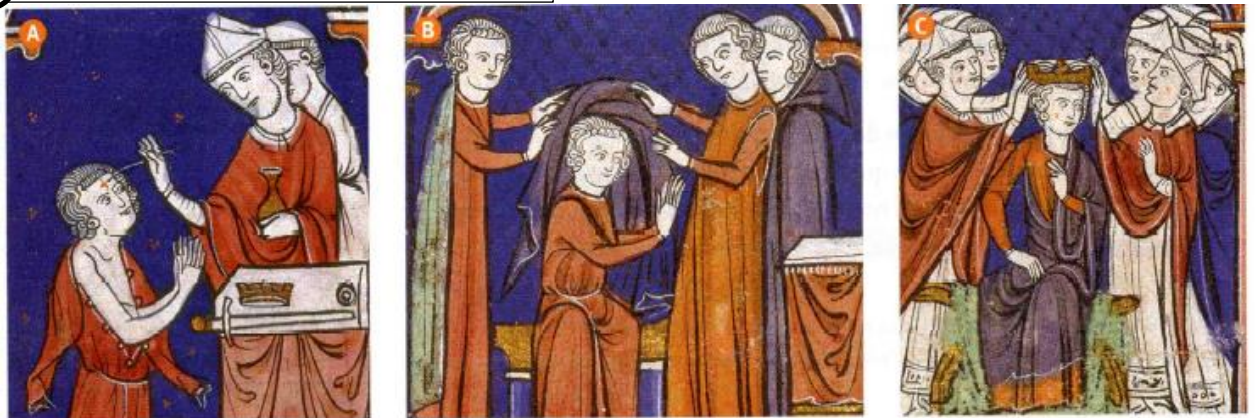
Détails de miniatures représentant le sacre de Louis IX, extraites de L'Ordre de la consécration et du couronnement des rois de France , vers 1280 (Bibliothèque nationale de France, Paris).