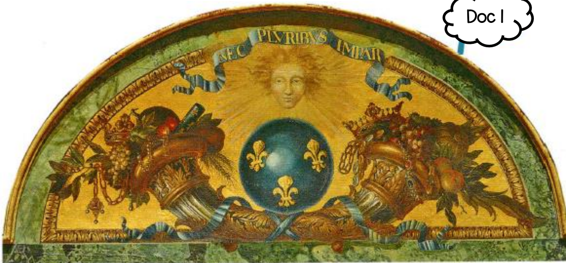
Peinture réalisée en 1672 par Louis XIV sur un plafond du château de Versailles. L'inscription en latin sur la banderole « NEC PLURIBUS IMPAR » signifie « Au-dessus de tous ».