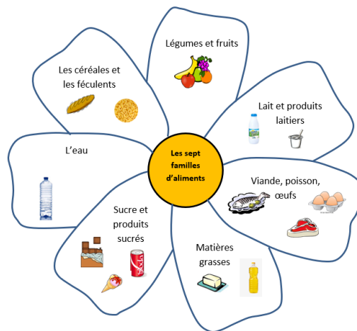
Fiche n°1 : Les 7 familles d'aliments