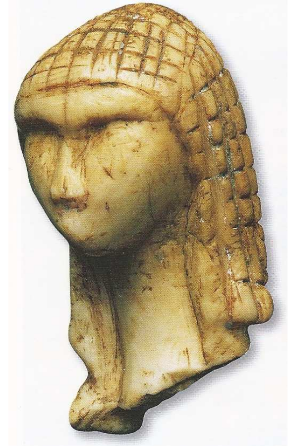
Tête de femme en ivoire, vieille de 23 000 ans, découverte à Brassempouy (Landes), Magellan, Hatier, 2009