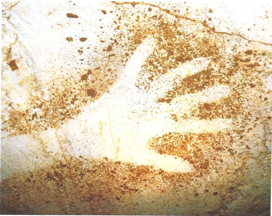
Main peinte, vieille de 27 000 ans, grotte de Cosquer (Marseille), Magellan, Hatier, 2009