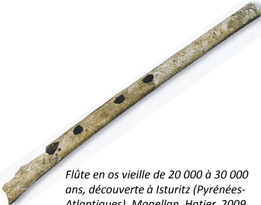
Flûte en os vieille de 20 000 à 30 000 ans, découverte à Isturitz (Pyrénées-Atlantiques), Magellan, Hatier, 2009