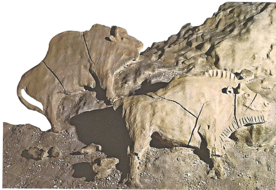
Des bisons en argile (le Tuc-d'Audoubert, Ariège, vers 16 000 av J.-C.), Les dossiers Hachette, Hachette, 2011