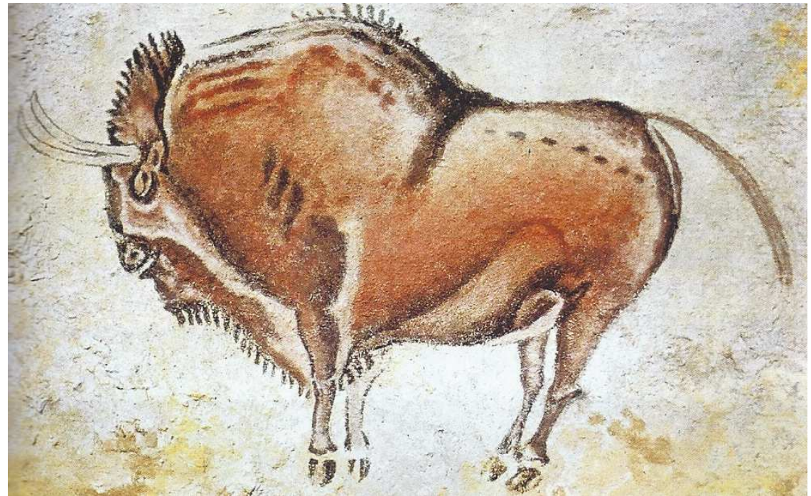
Bison de la grotte d'Altamira, Espagne, 15 000 av. J.-C., Les ateliers Hachette, Hachette, 2011