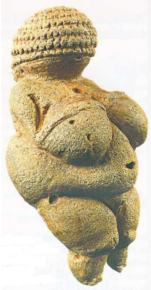
Statuette féminine de Willendorf, Autriche, 25 000 av J.-C., Les ateliers Hachette, Hachette, 2007