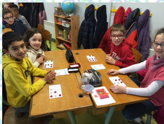
L'atelier LOTO DES MULTIPLICATIONS