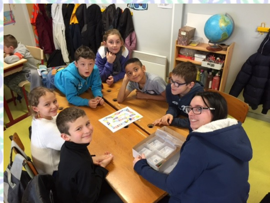
L'atelier ORTHOTOP ( jeu d'orthographe)