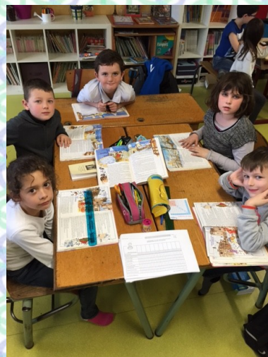
L'atelier LECTURE A VOIX HAUTE