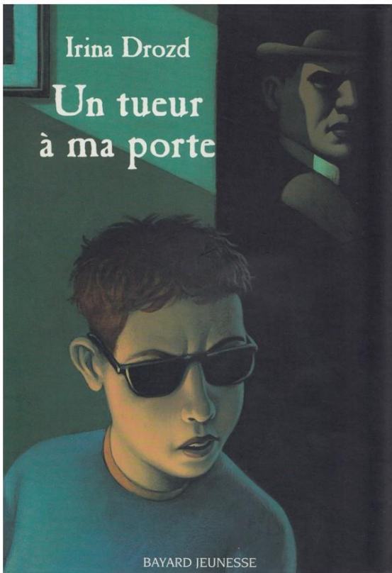
Première de couverture