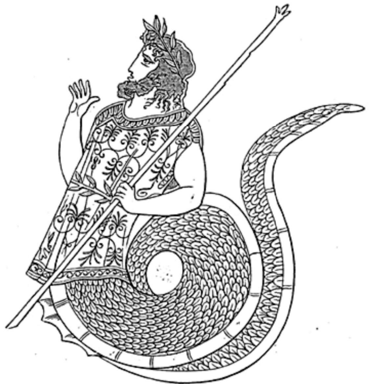
Cécrops, le roi-serpent, fondateur d'Athènes

- Cet arbre-là, leur dit-elle, aura des feuilles qui ne tomberont jamais, même au cœur de l'hiver. Et ses fruits auront le pouvoir de vous nourrir à satiété. Cet arbre vous rendra même célèbres dans le monde entier car il sera le symbole de la fécondité