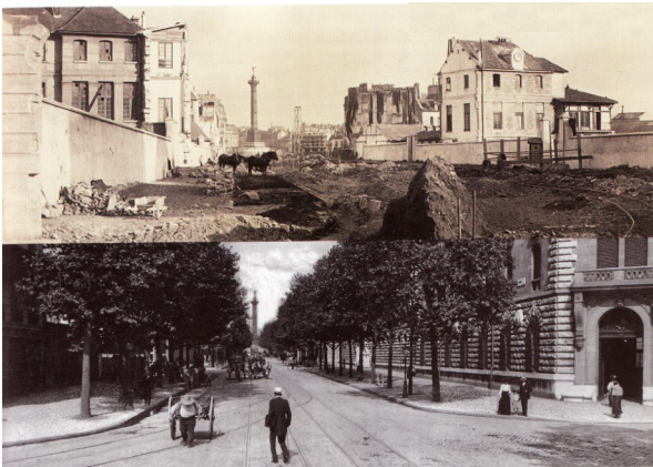
Histoire géographique Odysseo CM2

Le boulevard Henri IV à Paris, avant et après les travaux d'Hausmann