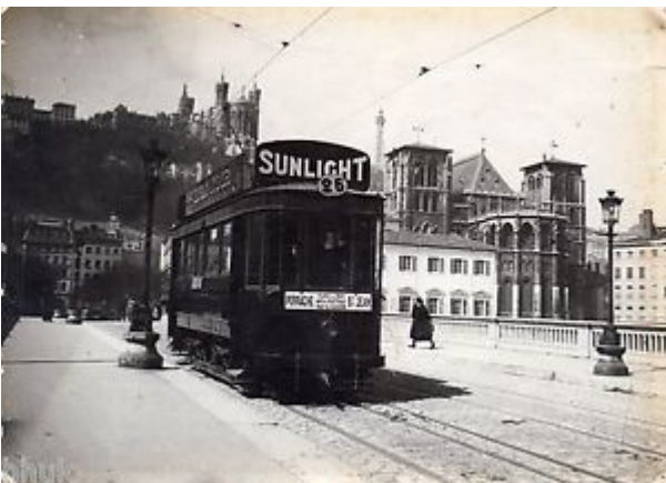
Histoire géographique Odysseo CM2