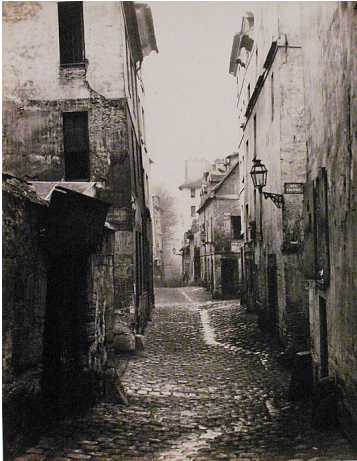
Histoire géographique Odysseo CM2

La rue Traversine, à Paris, au XIX e siècle