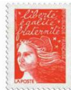
7 La « Marianne du 14 juillet » Timbre de 1999 La « Marianne du 14 juillet » ou « Marianne de Luquet » est une série de timbres émise du 14 juillet 1997 jusqu'en 2005.