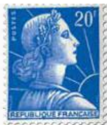
3 La « République de l'espérance » Timbre de 1955 La série « Marianne de Muller », également appelée « République de l'espérance », est émise à partir de 1955.