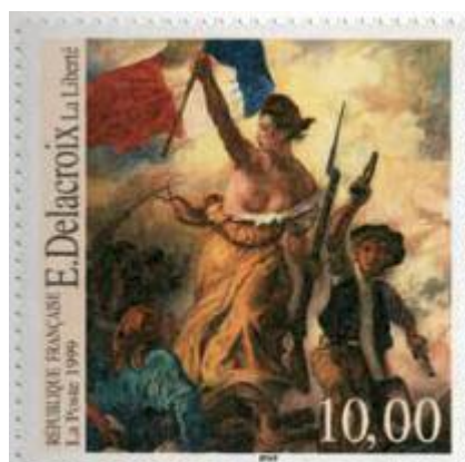
6 Une allégorie de la Liberté Timbre de 1989