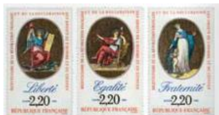
5 La devise républicaine Timbre de 1989