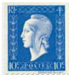
2 La « Marianne de Londres » Timbre de 1944 La « Marianne de Dulac » ou « Marianne de Londres » est une série de timbres conçue à la demande du général de Gaulle par le gouvernement britannique à partir de 1942.