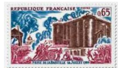
4 Un événement symbolique : la prise de la Bastille Timbre de 1971