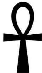
La croix d'Ankh