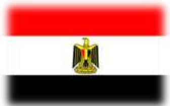
Le drapeau d'Égypte