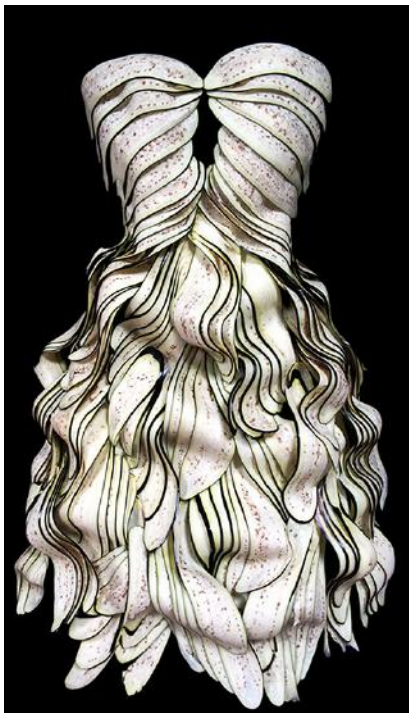
Wearable Foods: Eggplant dress