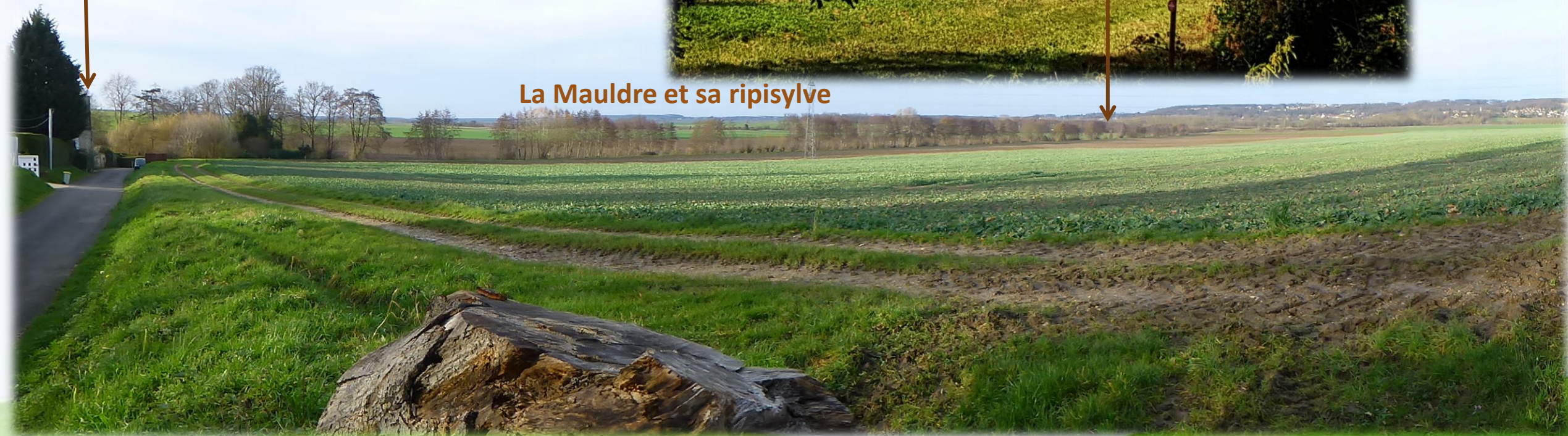
La Mauldre et sa ripisylve