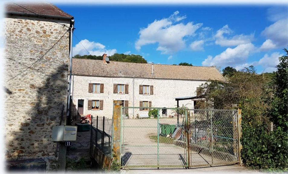
5 - LA RICHARDERIE la ferme de Potençon