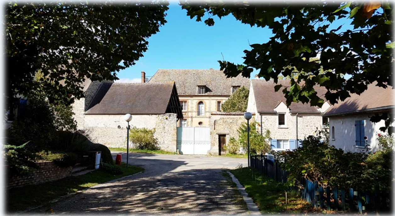
La ferme d'ERGAL anciennement dépendante du château de Pontchartrain