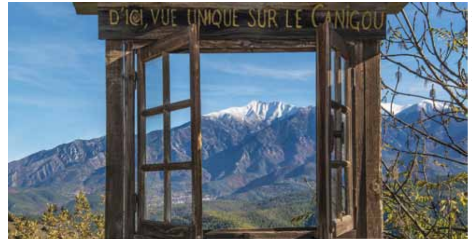
Jujols : fenêtre sur le Canigó.