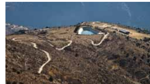
Jujols, le plan d'eau et la bergerie.

8 Descendre par la sente à gauche pour rejoindre les hauts du village. Retrouver la rue principale, puis le parking et l'église à droite.