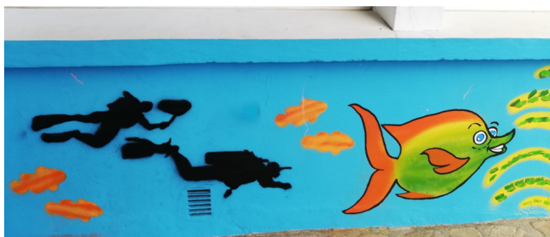
Les fonds marins entre crabes et algues, sur la cour

L'artiste Manu Gagneux, graffeur, a investi l'école et a entraîné les élèves de la Petite section au CM2 afin de donner vie aux murs fraîchement repeints de la cour des maternelles ainsi qu'à la salle de motricité toute neuve. Après un enseignement sur les dangers et limites de la peinture à la bombe dans les lieux publics, toutes les classes ont participé à la création de deux fresques.