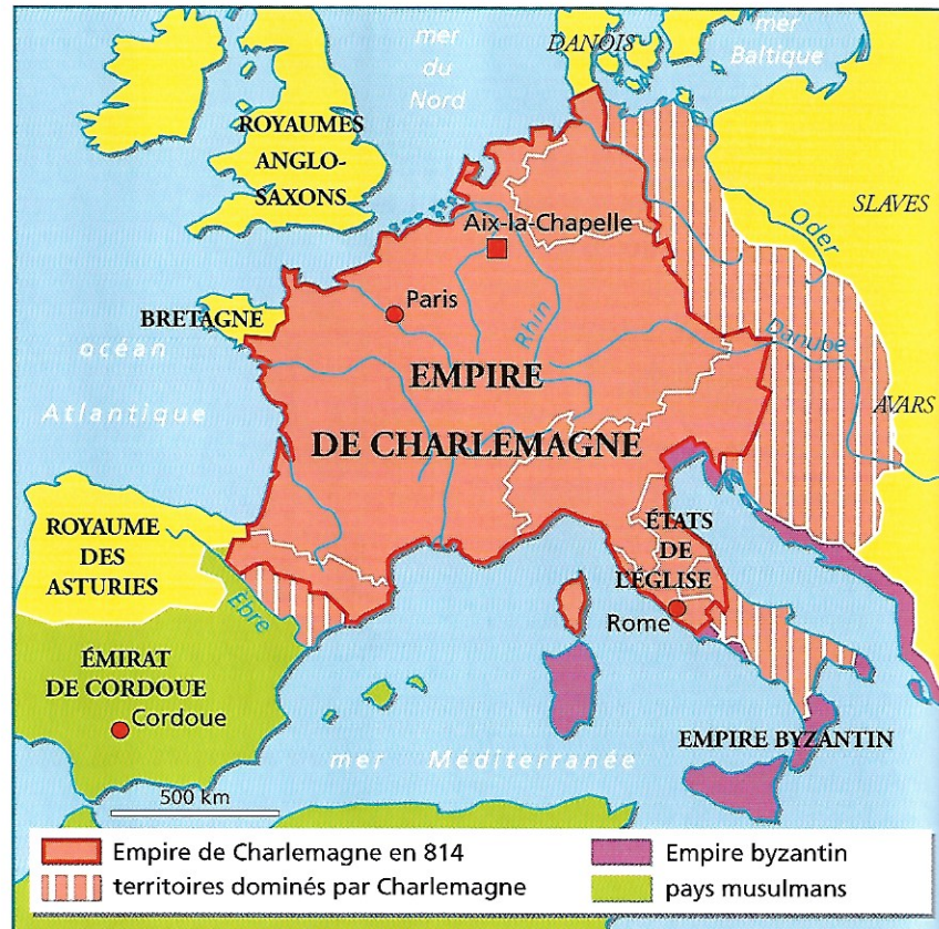
▲ Doc. 1 : L'Empire de Charlemagne en 814.

? Écris un texte pour montrer que la civilisation franque était brillante sous Charlemagne.