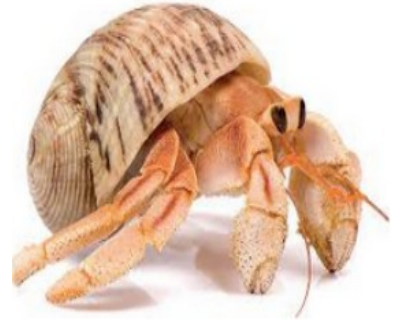
LE BERNARD L'HERMITE