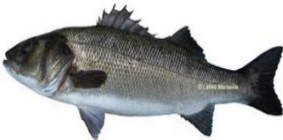
LE LOUP DE MER