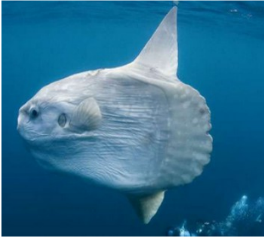
LE POISSON LUNE