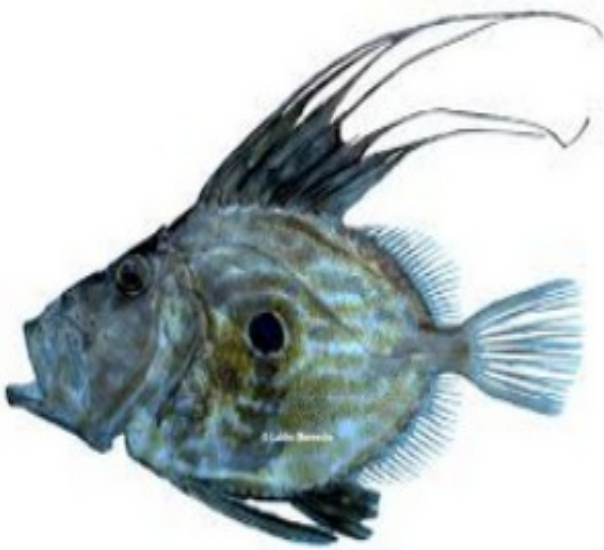
LE SAINT PIERRE