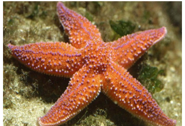
L'ETOILE DE MER