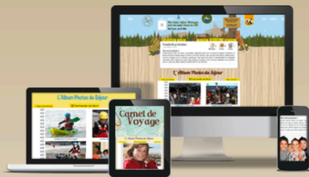
Compatible PC, tablettes et smartphones (IOS et Android)