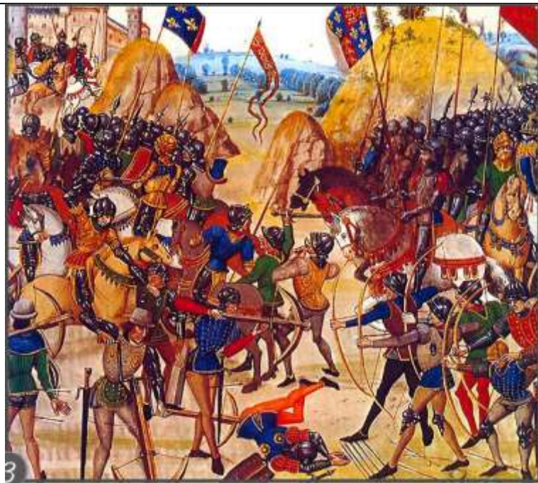
La bataille de Crécy (26 août 1346), miniature du XV ème siècle.

1/ Où et quand se déroule cette bataille?