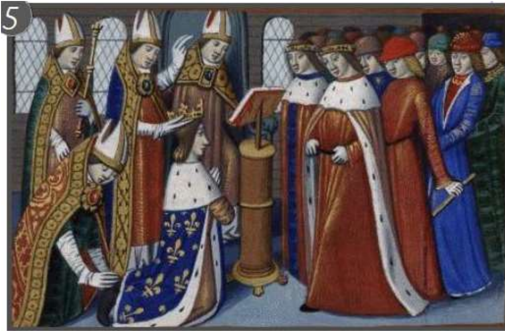
Le sacre de Charles VII, 1429, miniature du XVème siècle

Maintenant, grâce à Jeanne d'Arc, il est le vrai roi de la France. Charles VII est couronné roi en 1429 . Malheureusement, Jeanne est faite prisonnière en défendant Compiègne. Elle est accusée d'être une sorcière et condamnée à être brûlée vive. Jeanne d'Arc est brûlée à Rouen en 1431 . Mais les armées qu'elle a commandées continuent la lutte et chassent les Anglais de France.