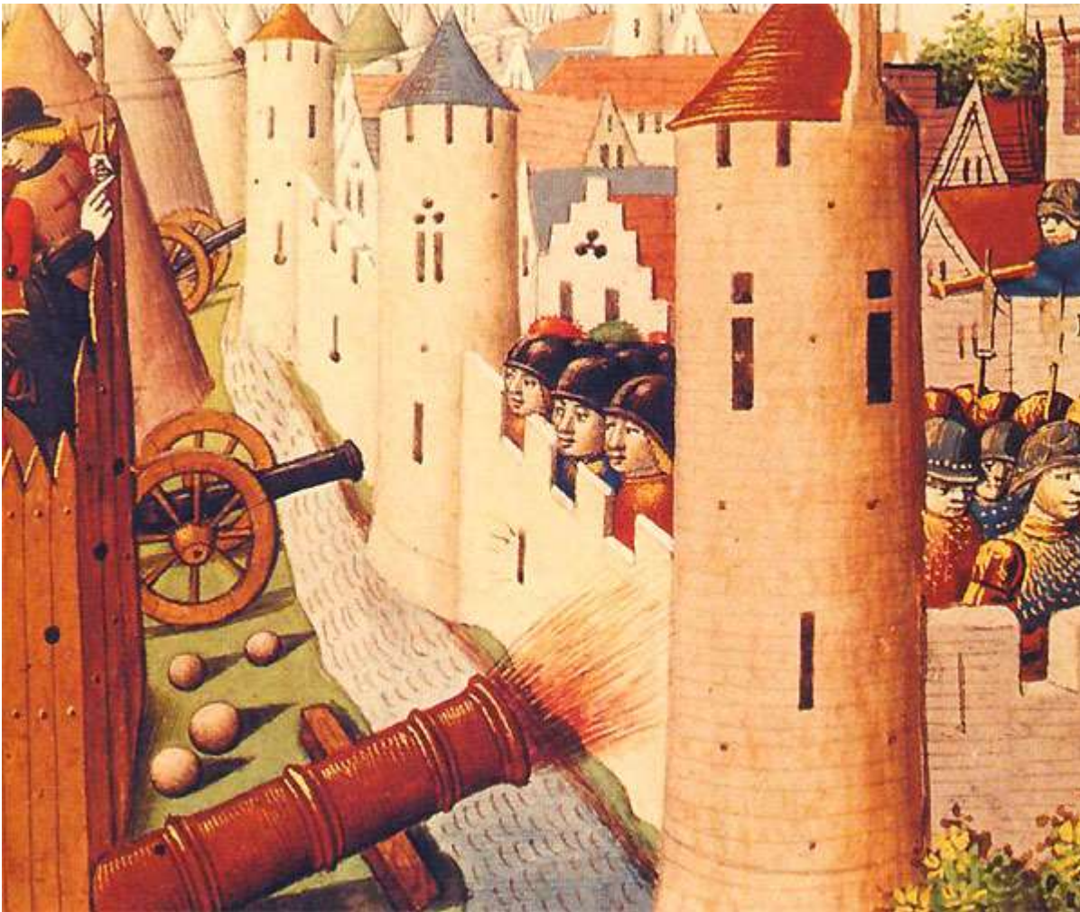
Le siège d'Orléans par le duc de Bedford (1428), miniature du Xvème siècle.

Orléans est délivrée en 1429. Jeanne d'Arc est acclamée et c'est une grande victoire.