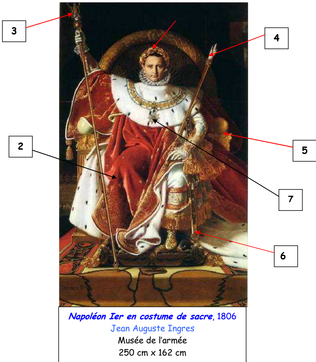
Napoléon Ier en costume de sacre, 1806 Jean Auguste Ingres Musée de l'armée 250 cm x 162 cm