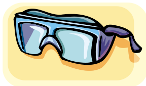
DES LUNETTES ANTI-PROJECTIONS