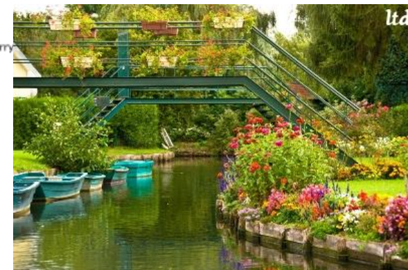
Les Hortillonnages d'Amiens