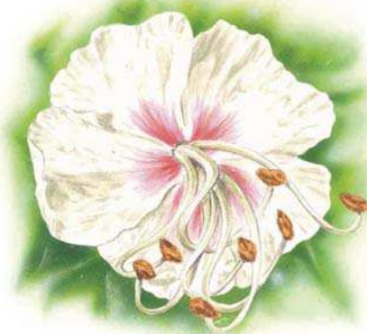
le cœur devient rouge après fécondation.