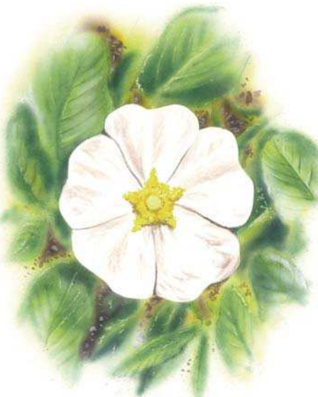
Fleur de ciste à feuille de sauge

se trouvent pollen et nectar. Formes et couleurs doivent les distinguer de la masse verte de la végétation chlorophyllienne. C'est d'autant plus important que la vision des insectes est moins performante que la nôtre. Leurs yeux composés donnent une image de faible résolution, faite de points distincts. Pour être repérée de loin, la fleur doit donc bien se détacher par sa couleur, sa forme et sa taille. Bien des fleurs de petite taille sont groupées en inflorescences, en épis ou en capitules pour être mieux visibles, comme