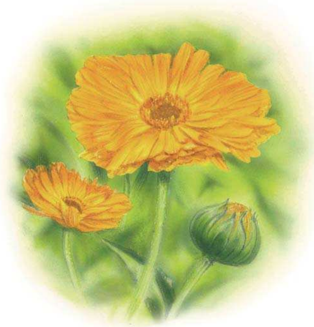
Flleurs de souci vues par l'œil humain