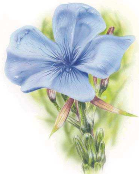
...et par l'œil d'un insecte.

cette "fleur" de souci qui en rassemble en fait plusieurs centaines. Une autre preuve que forme et couleur des fleurs s'adressent aux pollinisateurs nous est donnée par celles qui sont fécondées par le vent, comme les graminées. Leurs fleurs verdâtres sont discrètes et de petite taille : inutile pour elles de se faire remarquer. De même, certaines plantes attirent surtout les papillons de nuit qui les repèrent plus à l'odeur qu'à la vue. Aussi ces fleurs, comme la clématite sauvage ou le chèvrefeuille, sont peu spectaculaires mais diffusent un puissant parfum la nuit. Couleur, taille et parfum des fleurs