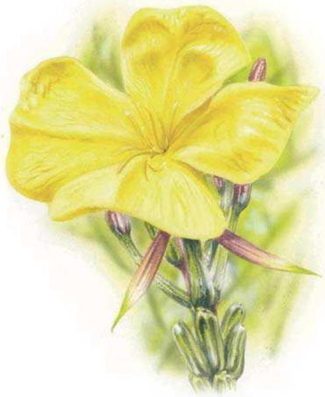
Fleur d'onagre vue par l'œil humain...