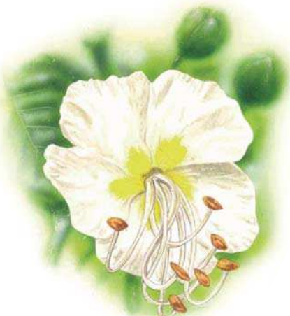
Fleur de marronnier d'Inde jeune, à cœur jaune