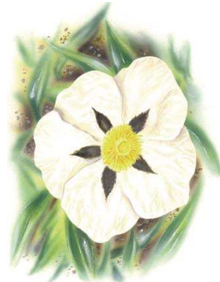
et de ciste porte-laudanum.