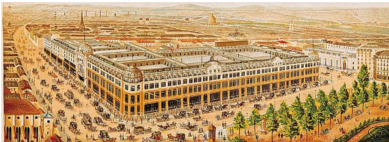
Le Bon Marché, Paris, 1905