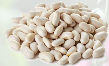
le haricot blanc