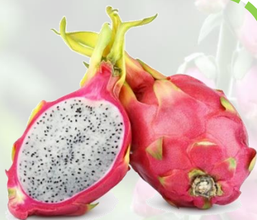
le pitaya ou fruit du dragon