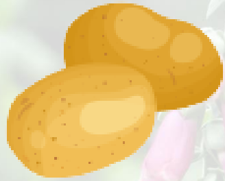
la pomme de terre