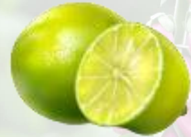
le citron vert