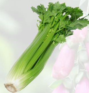
le céleri vert