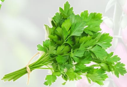
le persil plat