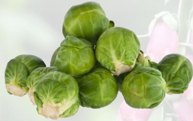
le chou de Bruxelles