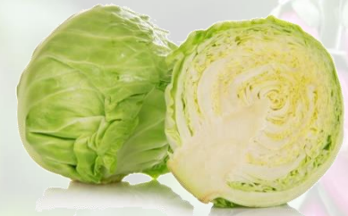
le chou blanc