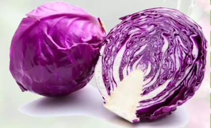
le chou rouge