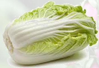
le chou chinois