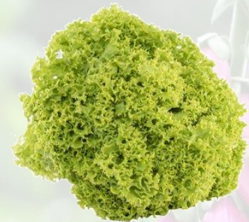
la salade frisée