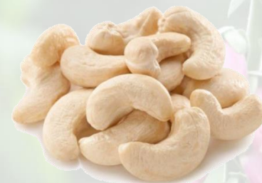
la noix de cajou