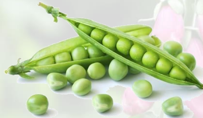
le petit pois