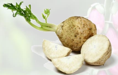
le céleri rave