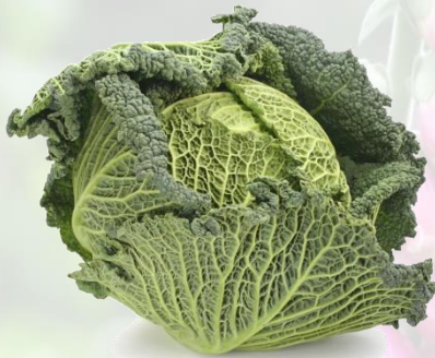
le chou vert