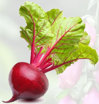
la betterave rouge