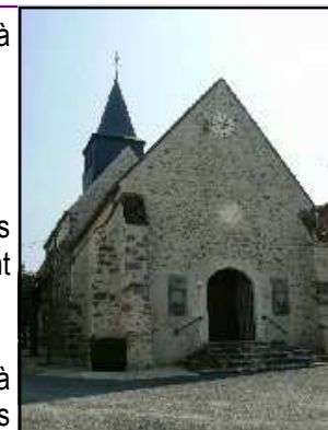
Eglise de St-Géroche

15—Laisser partir le GRP tout droite et descendre à droite le chemin qui devient route au niveau des maisons. 16 Prendre la D 15 à gauche et rejoindre Dagny.