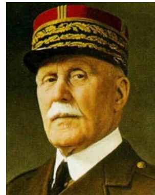
Doc E : Le maréchal Philippe Pétain

Petit à petit la Résistance grandit et s'organisa. Les Français acceptaient de moins en moins la collaboration. L'unité de la Résistance se fit autour du général De Gaulle. Par des attentats et des actes de sabotages, la Résistance prépara la libération du pays.