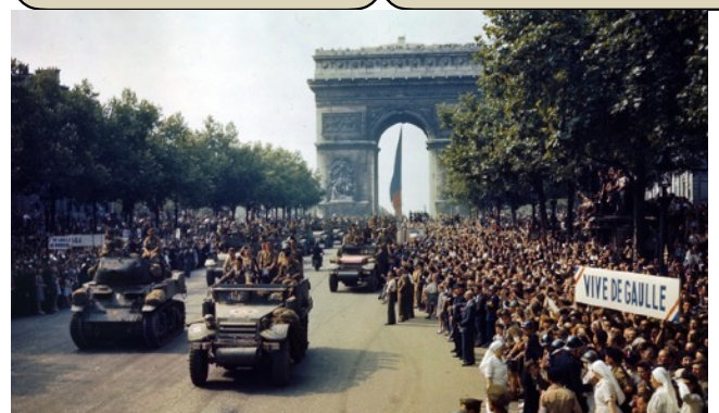
Doc D : Photo prise à la libération de Paris en 1944