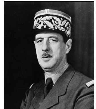
Doc F : le général Charles De Gaulle