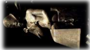
Une statue de Ramsès II