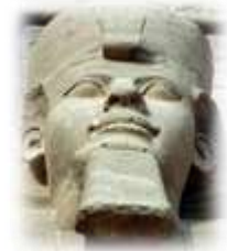
Une statue de Ramsès II