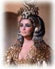
Une actrice qui joue Cléopâtre