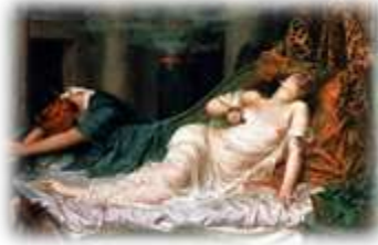
Une représentation de Cléopâtre