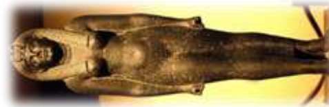
Une statue de Cléopâtre