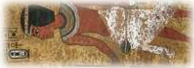
Une représentation de Toutankhamon