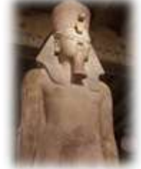
Une statue de Toutankhamon