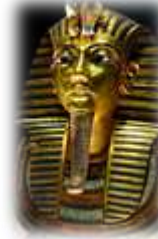
Le masque de Toutankhamon