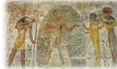
Une représentation de Ramsès II