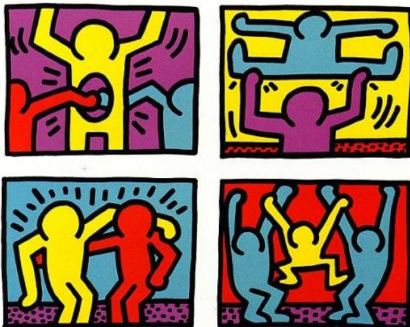
Pop shop quad 1

Nous avons observé quelques uns de ses tableaux.