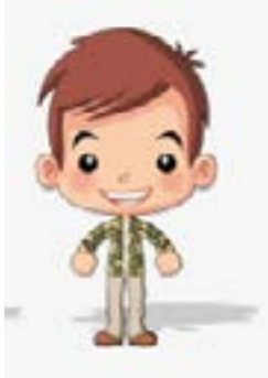
un garçon, un ami