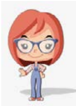
une fille, une amie