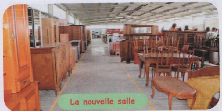
La nouvelle salle

Alors merci à tous les bénévoles, à tous ceux qui nous soutiennent d'une manière ou d'une autre, à Monsieur le Maire de Prahecq qui nous a toujours facilité la vie, à l'architecte qui nous a fait grâce de ses honoraires, à bien d'autres encore, bien sûr aux très nombreux donateurs sans qui rien de tout cela ne pourrait exister. Mais au-delà des remerciements habituels, je profite de l'occasion qui m'est donnée de dire publiquement que vous pouvez être fiers, compagnons d'Emmaüs, de travailler dans cette intelligence de "servir premier le plus souffrant", développant le sens de la solidarité, de la mutualisation et du faire-ensemble.