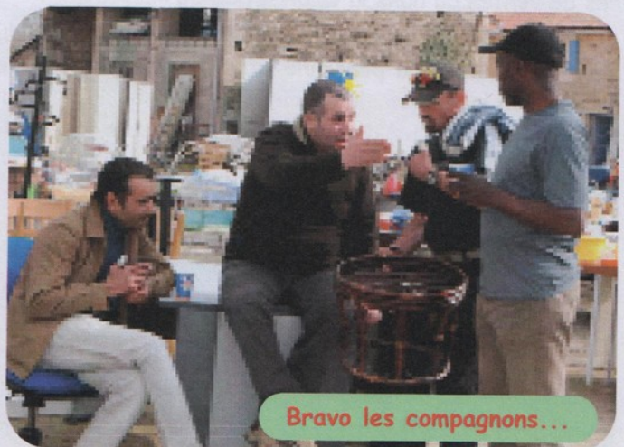
Bravo les compagnons...

Ce modèle économique a certes permis aux communautés de maintenir leur indépendance financière et donc leur liberté d'action et de