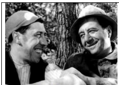
FERNANDEL et RAIMU