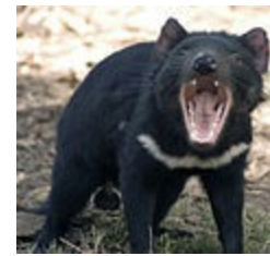
diable de Tasmanie