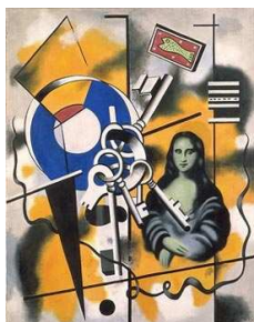
La Joconde aux clés