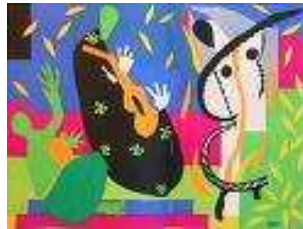
La tristesse du roi