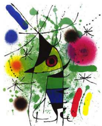
Le poisson chantant