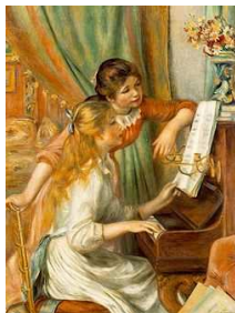
Jeunes filles au piano