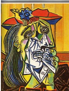
La femme qui pleure