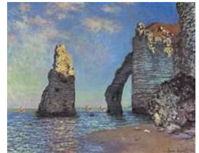
Les falaises à Etretat