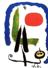
Complainte du lézard amoureux