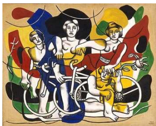
Les quatre cyclistes