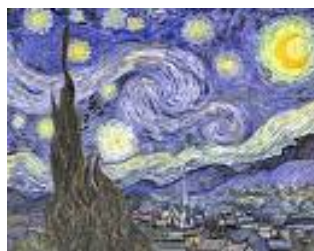
La nuit étoilée