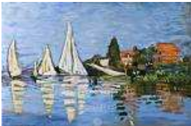
Régates à Argenteuil