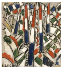
Le 14 juillet