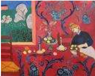
La chambre rouge