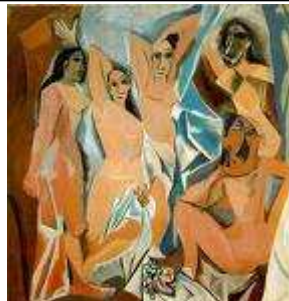
Les demoiselles d'Avignon