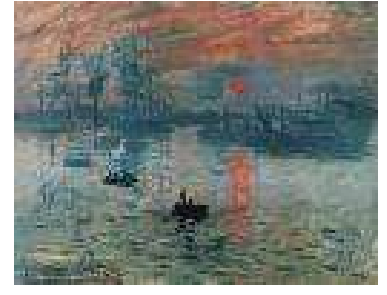
Impression, soleil levant