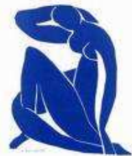
Le nu bleu