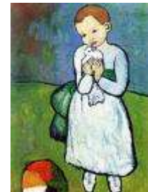
L'enfant au pigeon