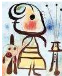
Femme et chat