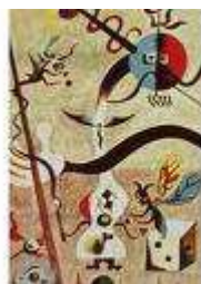
Le carnaval d'Arlequin