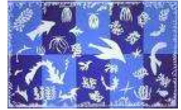
Polynésie: la mer