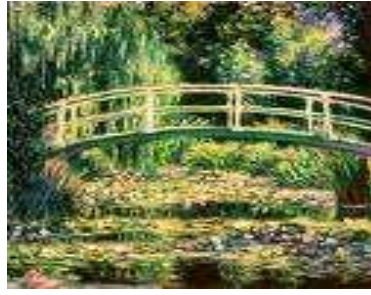
Le bassin aux nymphéas