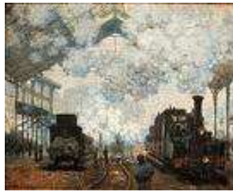
La Gare Saint-Lazare