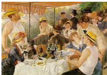
Déjeuner des canotiers