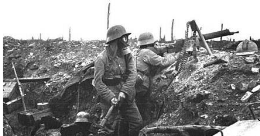
Doc 2 : soldats en 1916 (ils ont des masques contre les gaz, une mitrailleuse et ils lancent des grenades).