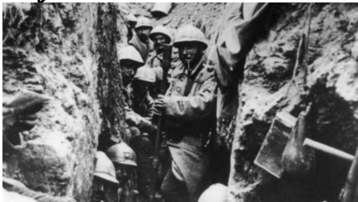
Docs 1 et 3 : soldats dans des tranchées (entassés dans des conditions difficiles, ils attendent la prochaine attaque).