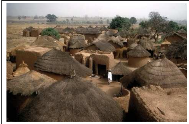
Village près de Korhogo

Voici une photographie d'un village en Côte d'Ivoire.