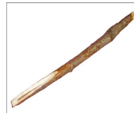
Un petit bout de bois