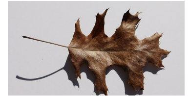
Une feuille marron