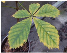
Une feuille de marronnier