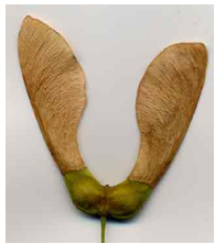
Une graine d'érable