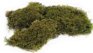
De la mousse