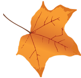
Une feuille orange