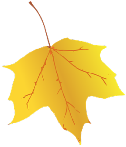
Une feuille jaune