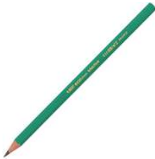
UN CRAYON A PAPIER un crayon à papier un crayon à papier