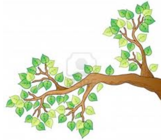
UNE BRANCHE une branche une branche