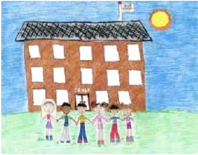
L'ECOLE l'école l'école