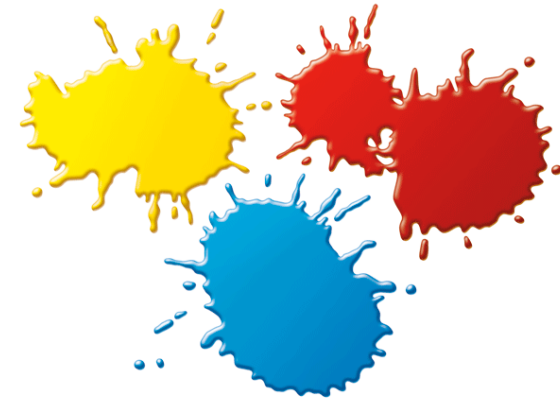
DES COULEURS des couleurs des couleurs