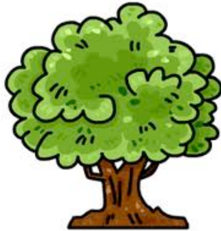
UN ARBRE un arbre un arbre