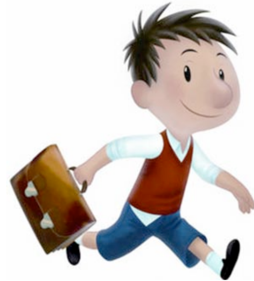
UN ELEVE un élève un élève