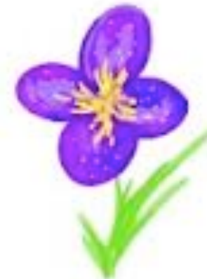
UNE FLEUR une fleur une fleur