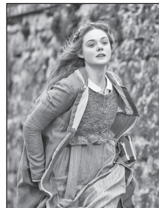
"Mary Shelley" de Haifaa Al Mansour