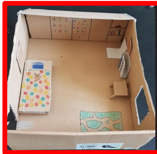
Modèle de référence