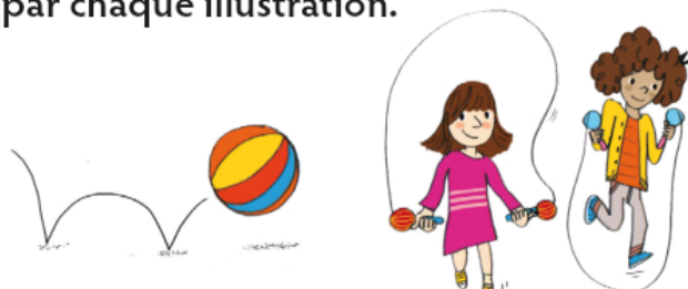
a. ... rebondit.

15 * Écris le sujet représenté par chaque illustration.