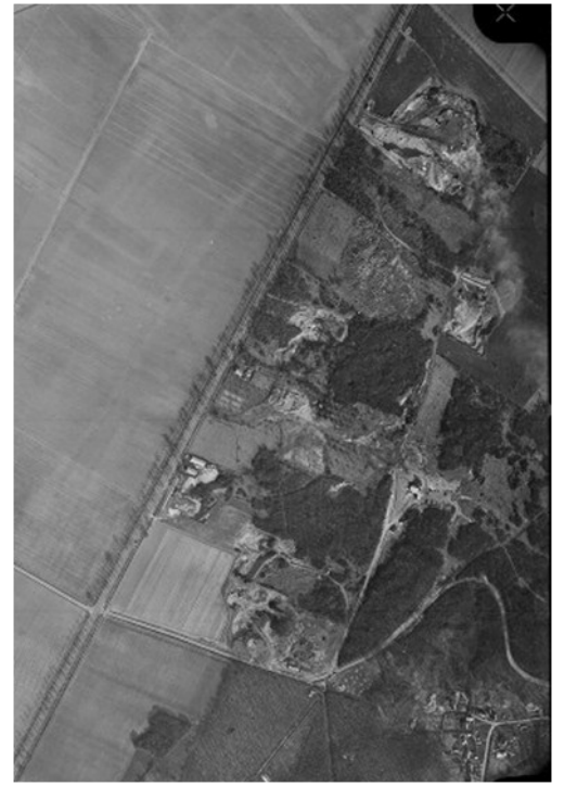
1966 consécration du lieu