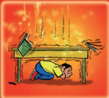
se protéger la tête et la nuque, s'éloigner des fenêtres