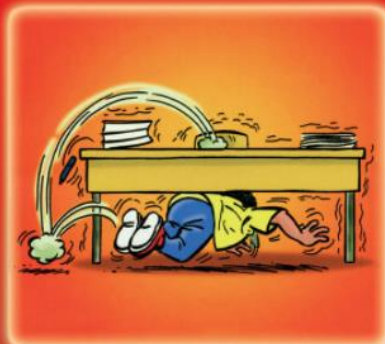
dès la 1 re secousse, se réfugier sous une table