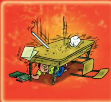
tenir les pieds de la table si elle bouge