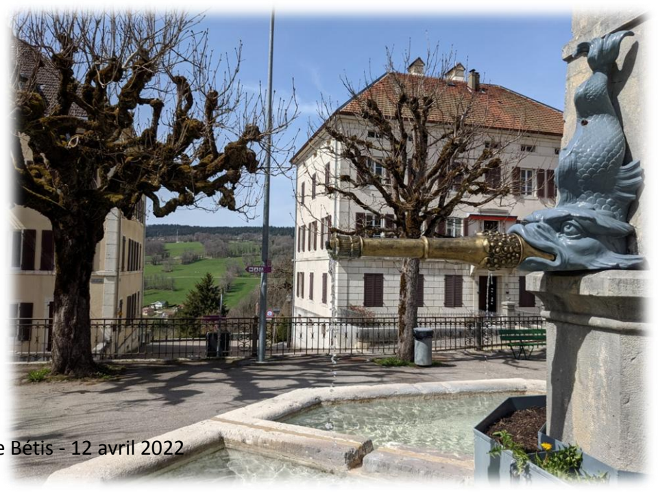
Montage d'Emérance Bétis - 12 avril 2022