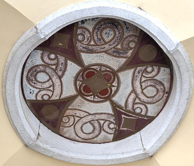
L' église des Brenets (Suisse)