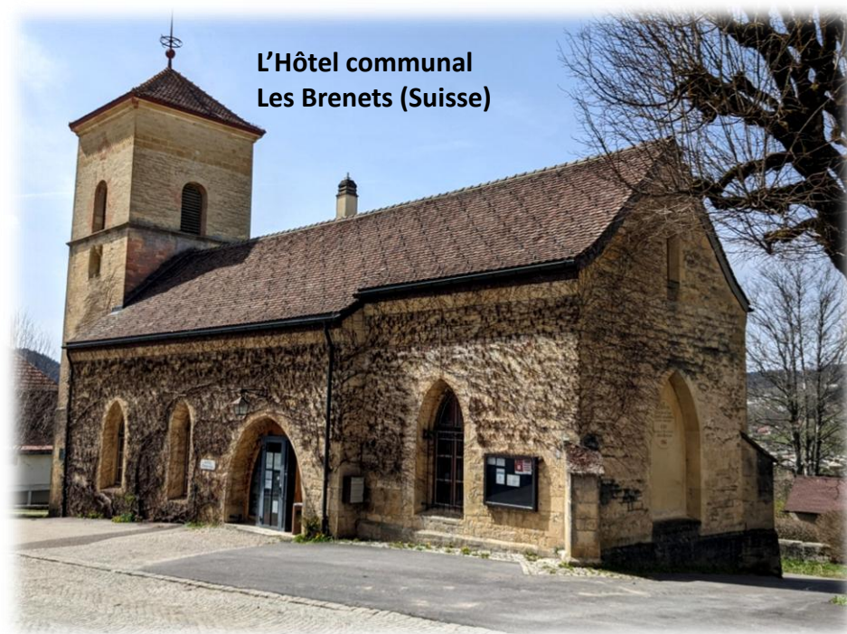
L'Hôtel communal Les Brenets (Suisse)