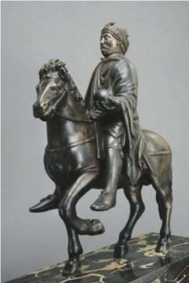
← Statue équestre de Charlemagne bronze autrefois doré. première moitié du 9ème siècle (Musée du Louvre)

Son fils, Pépin le bref, chasse le dernier roi fainéant. Le fils de pépin le bref, Charles, que l'on appelle Charlemagne (= Charles le grand en latin) devient roi en 771.