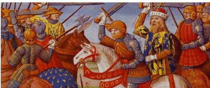
← Sur cette image, Charlemagne combat les Sarrasins en Espagne. Entoure Charlemagne.

Il dirige alors un très grand territoire et, comme il gouverne plusieurs pays, il devient empereur . La capitale de son empire est Aix-la-Chapelle .