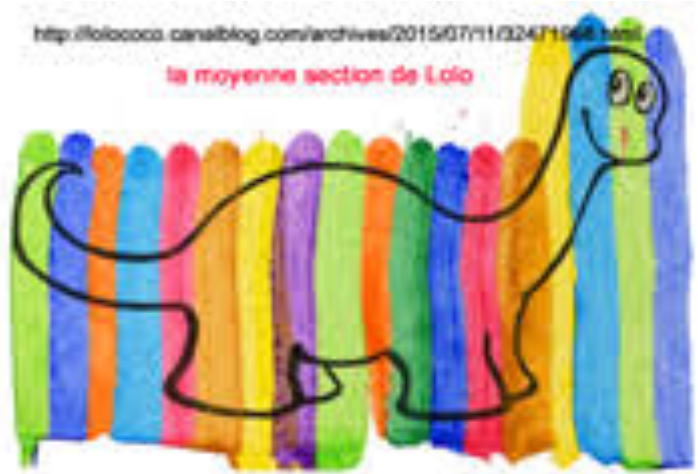
modèle pour les PS