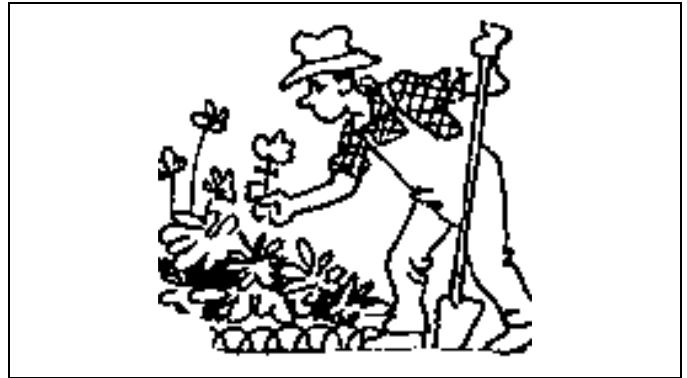
Le jardinier cueille une fleur,