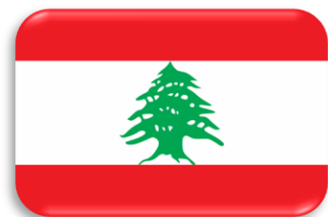
Drapeau du Liban